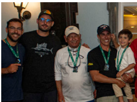
Equipe Ponta Negra