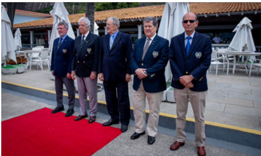
Representantes da Comodoria e Conselho Deliberativo na recepção ao Alto-Comando da Aeronáutica