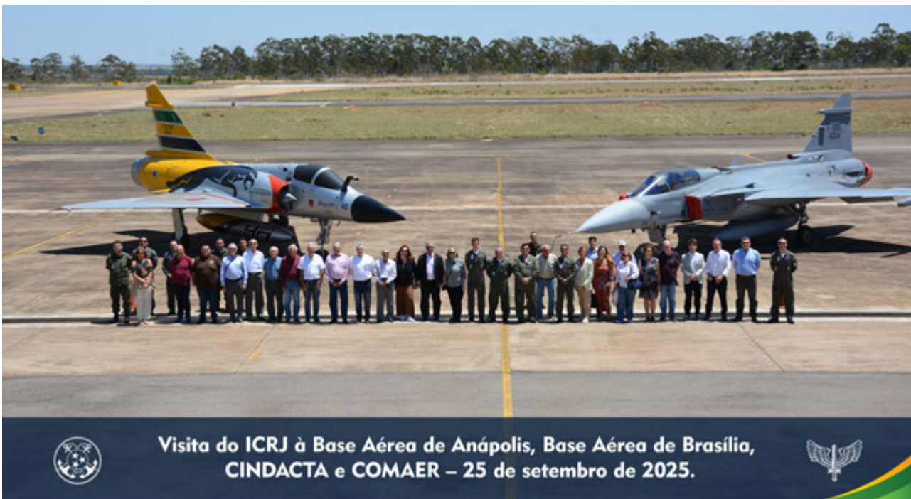
Visita do ICRJ à Base Aérea de Anápolis, Base Aérea de Brasília, CINDACTA e COMAER – 25 de setembro de 2025.

Ao final do encontro, Comodoro e Comandante trocaram presentes em nome do ICRJ e da FAB. A celebração contou ainda com uma novidade: a participação da Entreato Coral e Orquestra, que realizou um pocket show especialmente para a ocasião.