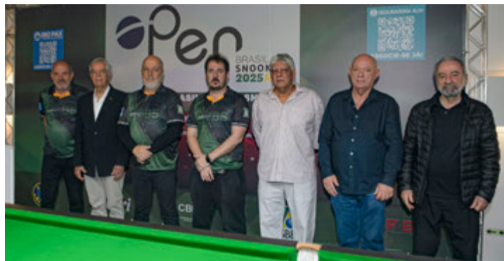
Cerimônia de abertura

O Open Brasil Snooker 2025 foi uma realização conjunta da CBBS (Confederação Brasileira de Bilhar e Sinuca), FSBERJ (Federação de Sinuca e Bilhar do Estado do Rio de Janeiro) e PABSA (Pan American Billiards and Snooker Association).