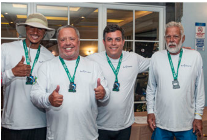
Equipe Bad Company