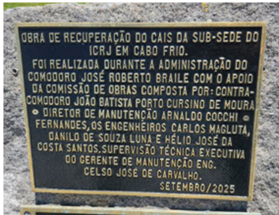
Placa oficialmente inaugurada