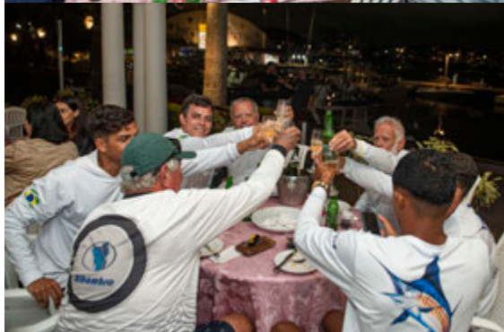
Confraternização entre as equipes e convidados