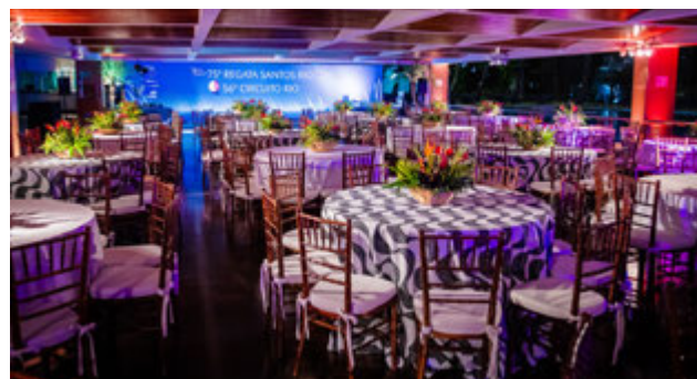
Festa produzida pela NR Eventos