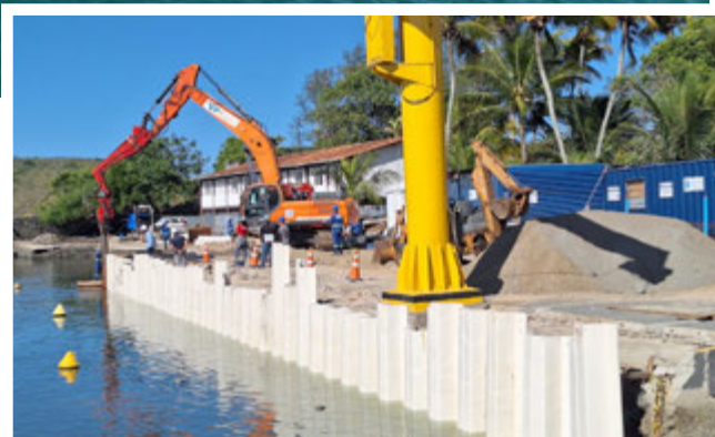
Obras em andamento

O resultado final cumpre todas as especificações técnicas do projeto e já demonstra, desde a conclusão, sua capacidade de resistir