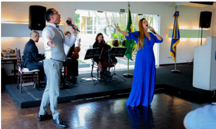
Entreatto Coral e Orquestra