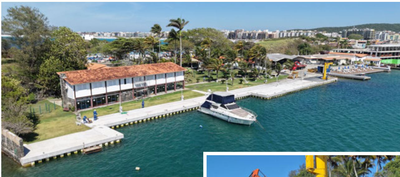
Subsede do ICRJ em Cabo Frio

No dia 12 de novembro, uma comitiva do ICRJ esteve na subsede de Cabo Frio para acompanhar a entrega de uma das obras estruturais mais relevantes dos últimos anos: a nova contenção e o píer revitalizado, resultado de um projeto executivo de alta complexidade.