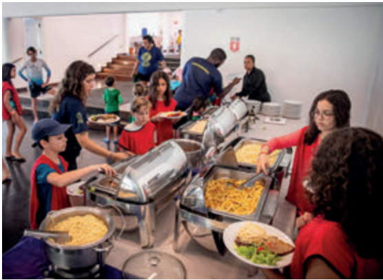
Almoço no salão Marlin Azul