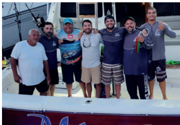
Equipe Makaio - campeã do 31º Cabo Frio Marlin Invitational