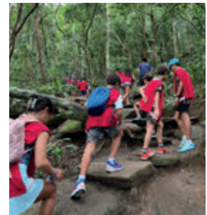
Trilha ecológica no Morro da Urca