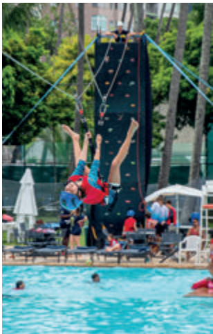
Tirolesa na piscina