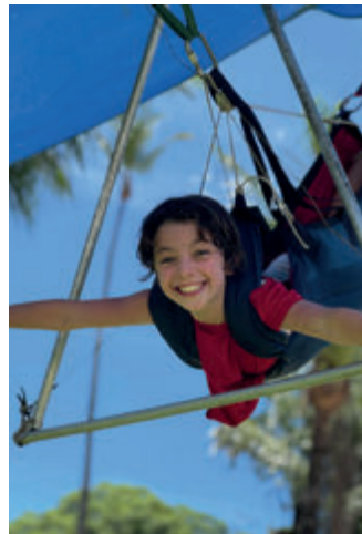
Simulador de asa delta