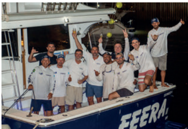
Equipe Feera - campeã do Marlin Rio 2024