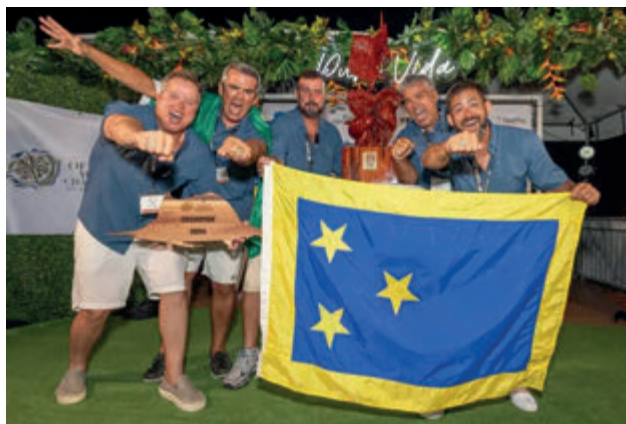
Equipe Cocoroca - campeã OWC 2024