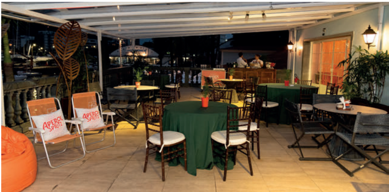
Camarote Lounge Aperol