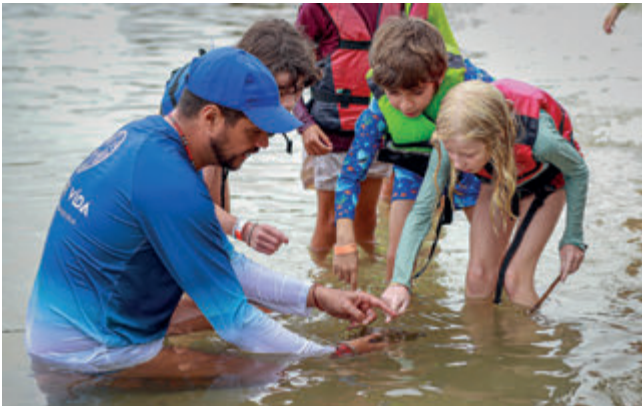
Explorando a Praia do Morcego e aprendendo sobre a vida marinha da Baía de Guanabara