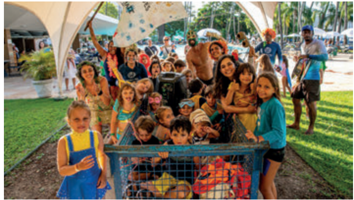
Bloquinho de carnaval com bandeira e adereços confeccionados nas oficinas