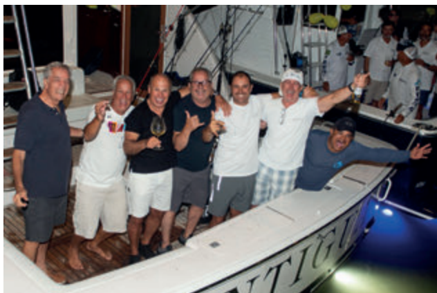
Equipe Antigua - campeã do 62º Torneio de Peixes de Bico

O OWC acontecerá entre os dias 6 e 10 de abril de 2025, na Costa Rica, onde pescadores terão a oportunidade de estarem a bordo dos melhores barcos do país em busca de marlins, sailfishes e outras espécies.