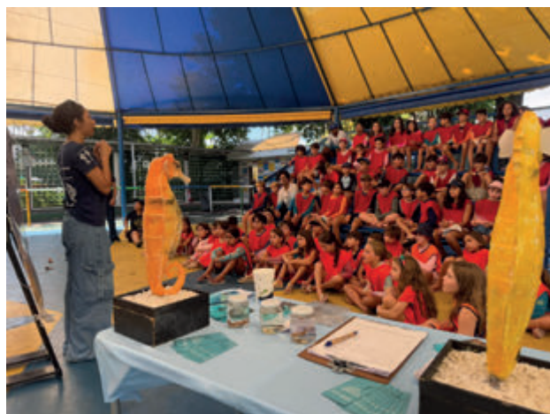
Projeto Cavalos-Marinhos RJ em apresentação no Cirquinho Popeye

Toda a programação incluiu, ainda, alimentação e utilização de copos ecológicos. Com o sucesso da colônia de verão, a EDN já está estudando a possibilidade de trazer novas atividades recreativas e socioeducativas para as férias de julho.