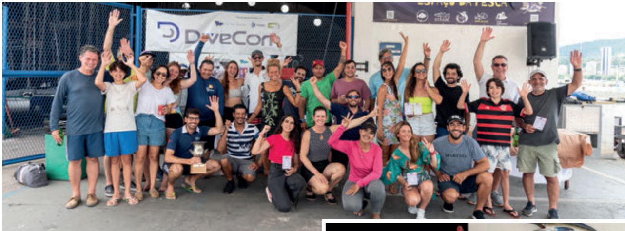
Confraternização no hangar 3

Nos dias 14 e 15 de dezembro, a classe Snipe encerrou o ano de 2024 com a tradicional Taça Ivan Pimentel, celebrando o legado do velejador que marcou gerações na vela. Com o total de 4 regatas para 22 barcos, os dias foram de grandes disputas e celebrações.