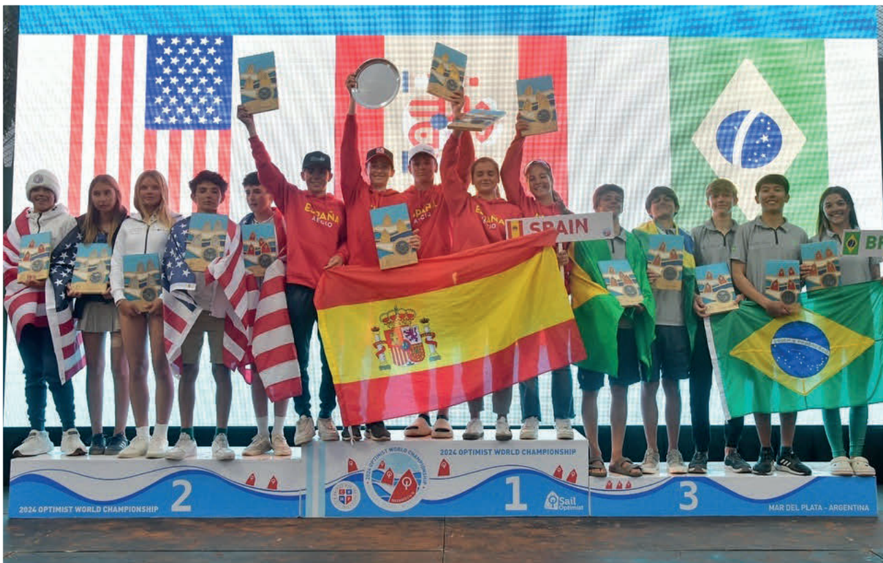
Brasil, 3º país colocado na Nations Cup