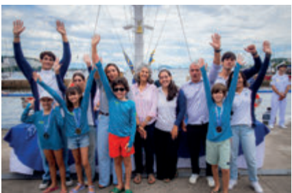
Formandos da Vela Infantil