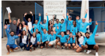
Turma de formandos da classe Dingo