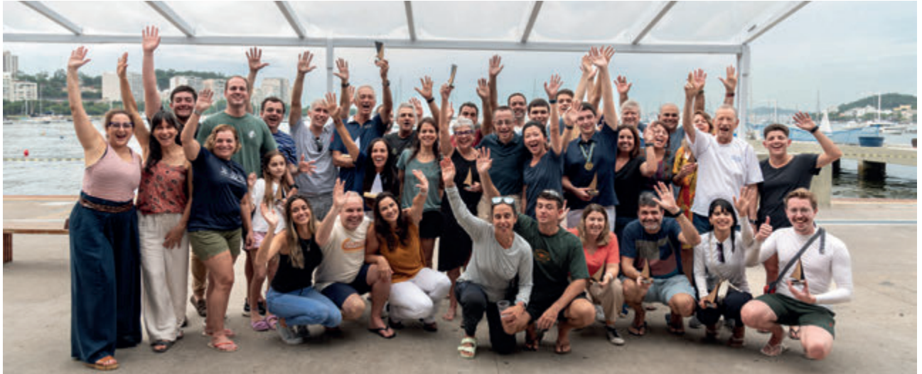
Confraternização no Bar dos Pinguins

A flotilha da classe Dingue do ICRJ se despediu de 2024 em grande estilo: velejada, amigos e churrasco. No dia 14 de dezembro, foi realizada a Regata Antônio Bellas, em homenagem a Antônio Bellas, Capitão de Flotilha no ano de 2023. Após a regata com a participação de 16 barcos, velejadores e convidados confraternizaram em um churrasco no Bar dos Pinguins.