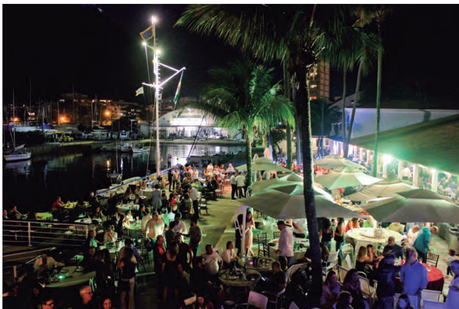
Varanda do ICRJ lotada