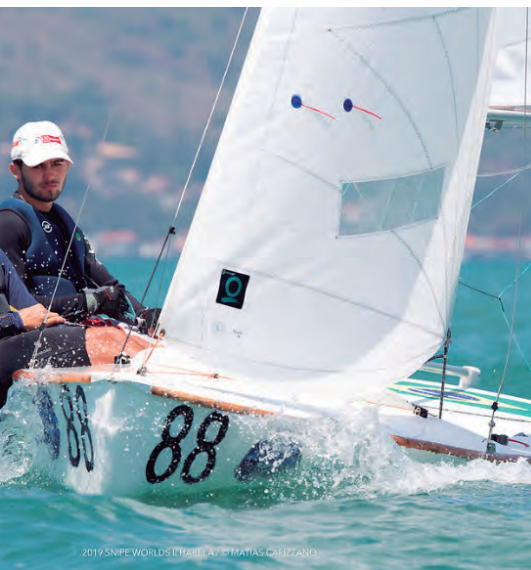
2019 SNIPE WORLD CHAMPIONSHIP