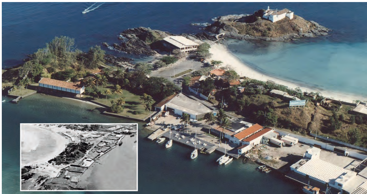
Em 1956 (Foto menor, em preto e branco) e em 2005 (foto maior)

Ao longo dos anos, a subsede cresceu. Os investimentos na propriedade foram muitos e hoje a infraestrutura é ótima para receber os associados e seus convidados em um dos seus 20 apartamentos, áreas verdes, sauna seca e a vapor, restaurante, hangar para embarcações, 109 metros de cais, além de um mirante extensivo à Praia do Forte com vistas deslumbrantes que fazem dessa subsede a preferida de muitos sócios.