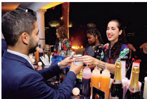
Equipe do Bobô Drinks

Associados e convidados elogiaram a festa e enviaram mensagens para os meios de comunicação oficiais do clube pedindo uma nova edição. O próximo Sunset Lounge ainda não tem data agendada, mas esperamos em breve anunciar o próximo. Acompanhe a nossa programação e não perca!