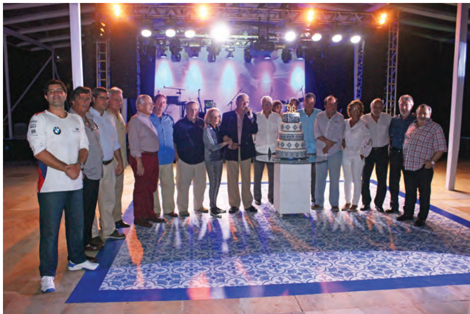
Comodoria e Conselheiros