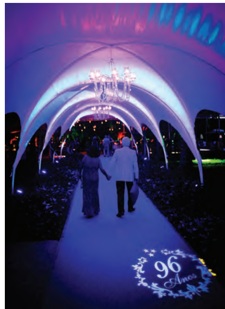
Decoração de entrada