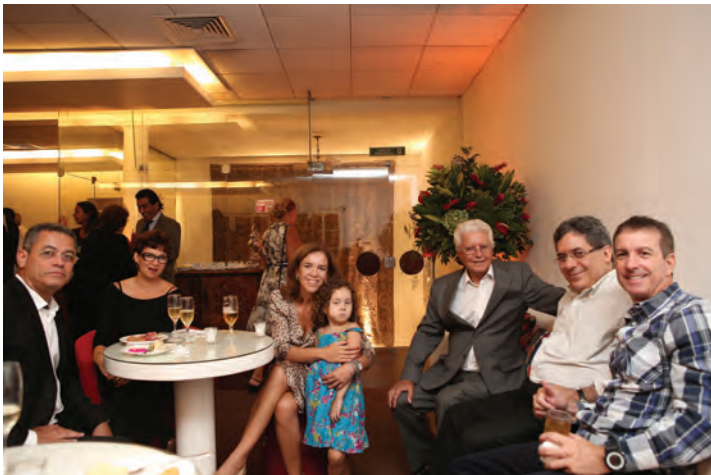
Coquetel de confraternização no Salão Nobre