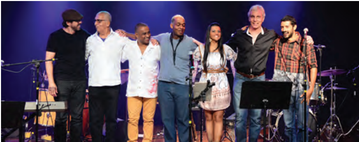
Urca Bossa Jazz

Sábado à noite é dia de rock! No dia 21 de maio, o Salão Marlin Azul receberá a banda Urca Bossa Jazz com a turnê de lançamento do CD “Saudades do Raul”, em referência aos 70 anos de nascimento do cantor completados em 2015. O álbum foi produzido ano passado a partir de uma série de shows da banda em homenagem ao rei do rock brasileiro.