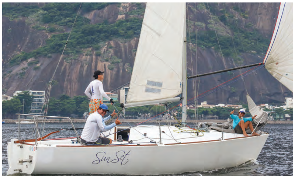
Barco Sunset - Campeão na Regata Carlos Alberto de Brito - Classe J24

A tradicional regata que leva o nome de uma das figuras mais carismáticas da história do ICRJ, a Regata Carlos Alberto de Brito, contou com a participação de mais de 70 velejadores em 21 barcos no total.