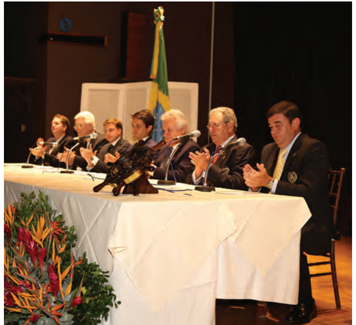
Mesa diretora do Conselho e Comodoria