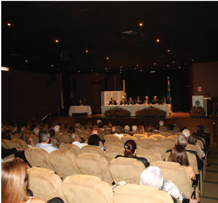
Cerimônia de posse