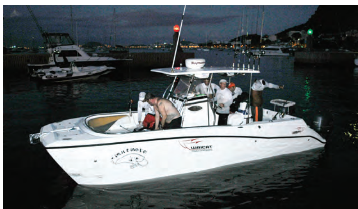
Equipe Fish Finder

Neste dia, a estratégia de muitas equipes foi pescar próximo às plataformas e boias na expectativa de capturar peixes de pontuação dobrada, mas o resultado infelizmente não foi o esperado. Vamos aguardar para ver como vai ser a 2ª etapa que está marcada para o dia 07 de maio.