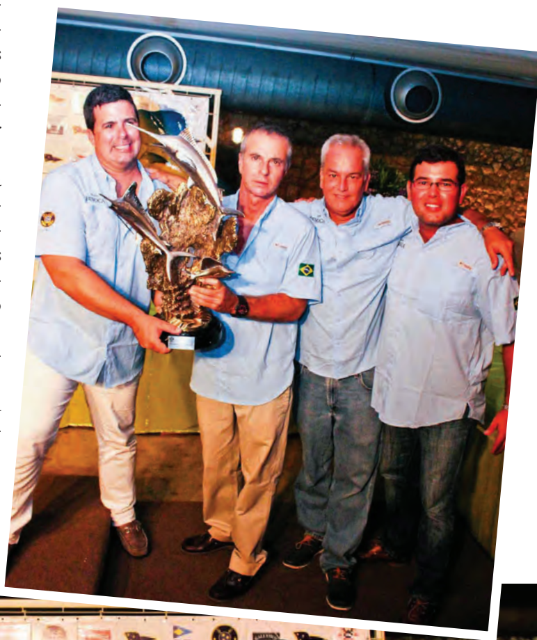
Equipe Binoca - campeã do Torneio de Peixes de Bico, Eficiência Helio Barroso e Copa ICRJ

Após a cerimônia, a pista de dança foi aberta ao som de muito pop e rock com a banda Além do Rock e, em seguida, entrou a Bateria da Escola de Samba Mocidade Independente de Padre Miguel. A pista de dança ficou lotada até o final do evento, por volta das 3h30 da madrugada.