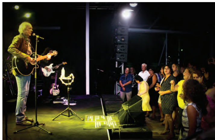
Show do Erasmo Carlos na festa do ICRJ