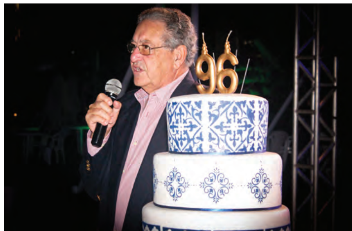
Comodoro Paulo Fabiano