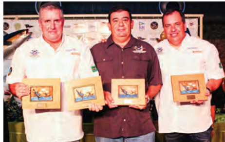
Equipe Release - Campeã do Torneio Open 27,5