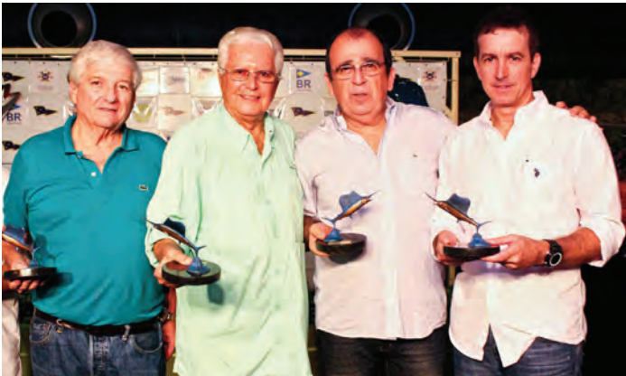
Equipe Jenny - Campeã do Torneio de Encerramento