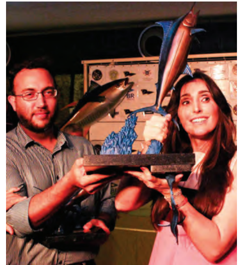
Equipe Paola - Campeã do Cabo Frio Marlin Invitational