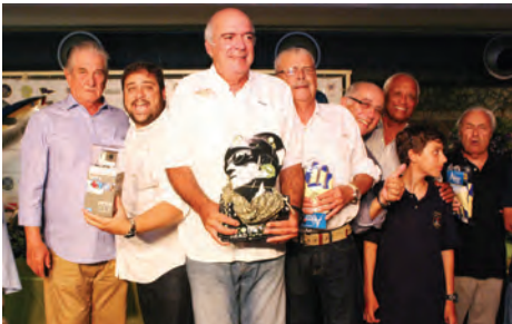
Equipe Alhambra - Campeã do Torneio Marlin Rio