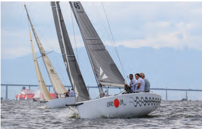
Barco Carioca Fiote - 1º lugar no HPE 25

A cerimônia de premiação foi realizada no dia 10 de março no Salão Nobre do Clube.