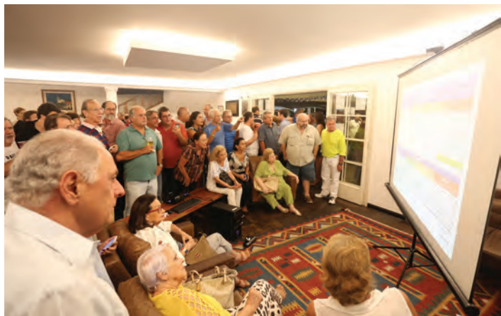
Divulgação do Resultado no hall abaixo do Salão Nobre