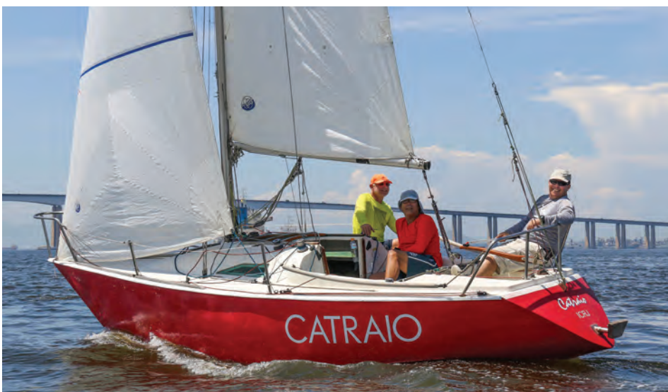
Barco Catraio - Campeão na Ranger 22