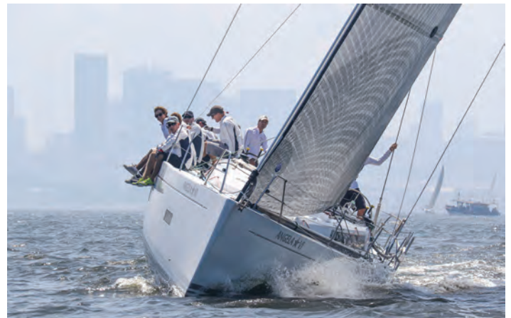
Ângela Star VI - 1º lugar na ORC