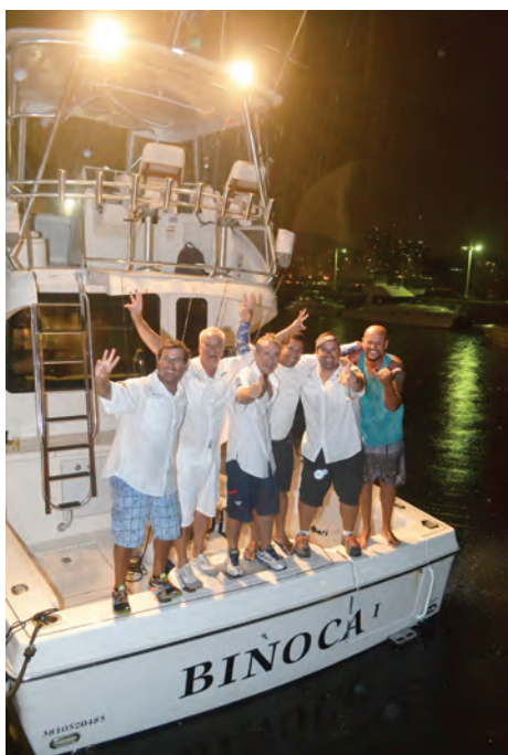
Equipe Binoca - Tricampeã do Torneio de Peixes de Bico e Campeã da Copa ICRJ