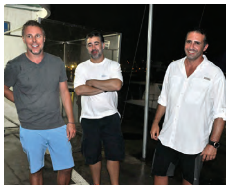
Equipe Perfeita - 3ª colocada no Torneio de Peixes de Oceano