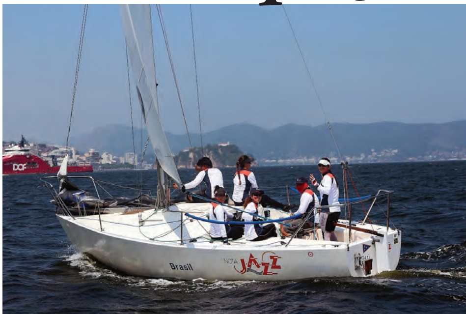
Nota Jazz - Estadual j24