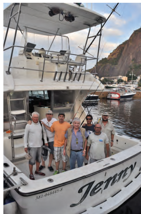
Equipe Jenny - 3ª colocada no Torneio Anual de Peixes de Bico