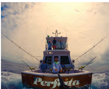
Equipe Perfeita - 3ª colocada no Torneio de Peixes de Oceano