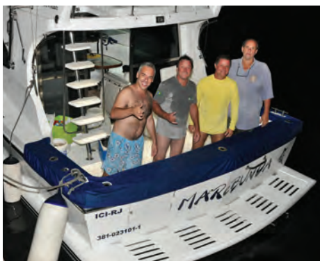
Equipe Marebunda - Vice-campeã do Torneio de Peixes de Oceano