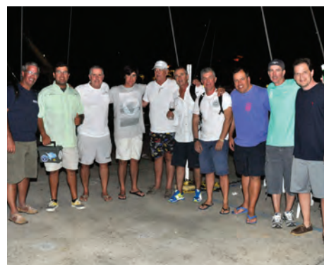
Confraternização entre equipes