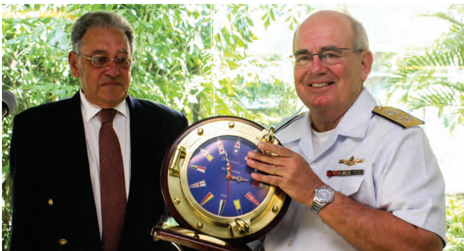
Comodoro e o Comandante da Marinha