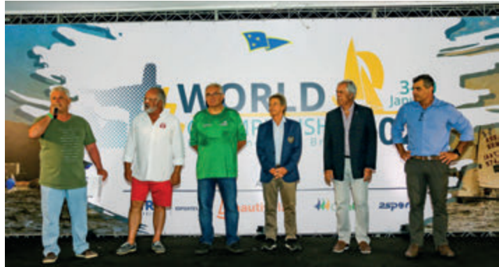
Membros da Diretoria e Comodoria do ICRJ, da CBVela e da Associação Internacional da Classe 420 no encerramento do evento

O Campeonato Mundial da Classe 420 foi organizado pelo late Clube do Rio de Janeiro e pela International 420 Class Association com o apoio da Prefeitura Municipal do Rio de Janeiro, da Confederação Brasileira de Vela (CBVela), e das empresas 2sports, MightyGreens, Nutty Bavarian, Oh a água e MSA Spa.