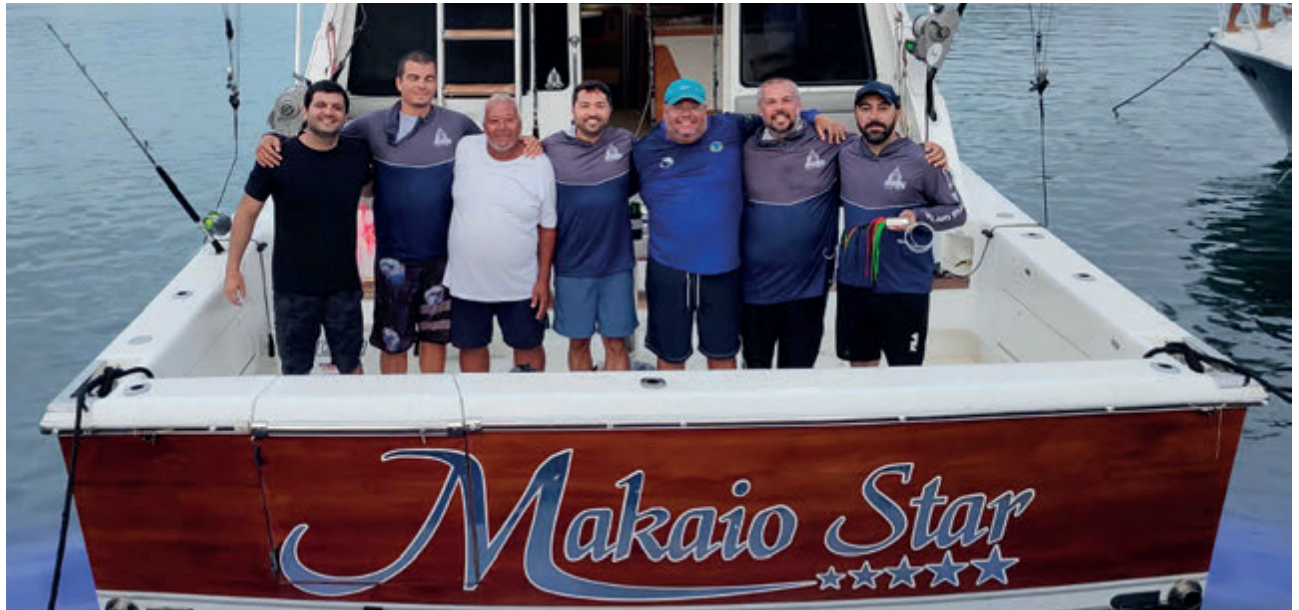
Equipe Makaio Star

Em sua 31ª edição, o Torneio Cabo Frio Marlin Invitational, realizado na subsede do ICRJ em Cabo Frio, contou com a participação de 12 equipes. Com alto nível de pescadores, as disputas aconteceram em 3 etapas nos dias 20, 25 e 28 de janeiro de 2024.