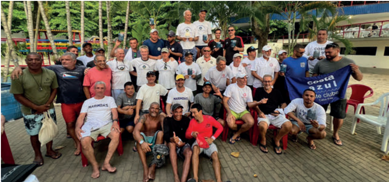
6 clubes na disputa do título