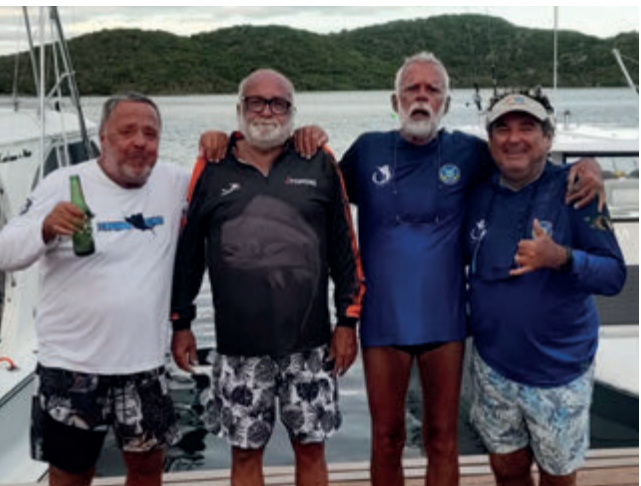
Equipe Bad Company