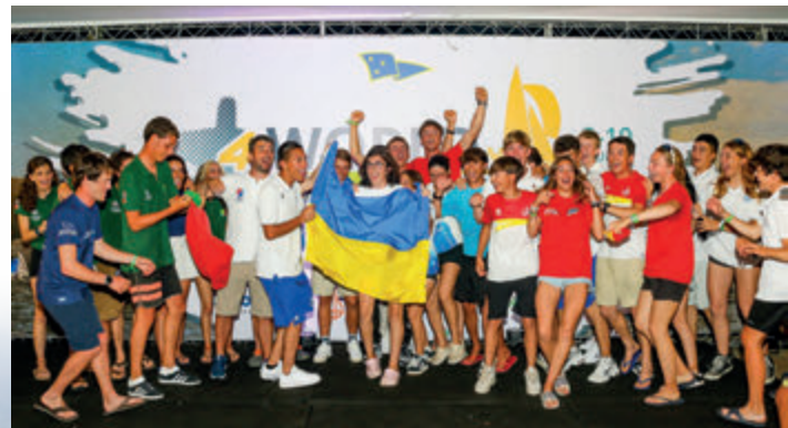
Festa das nações