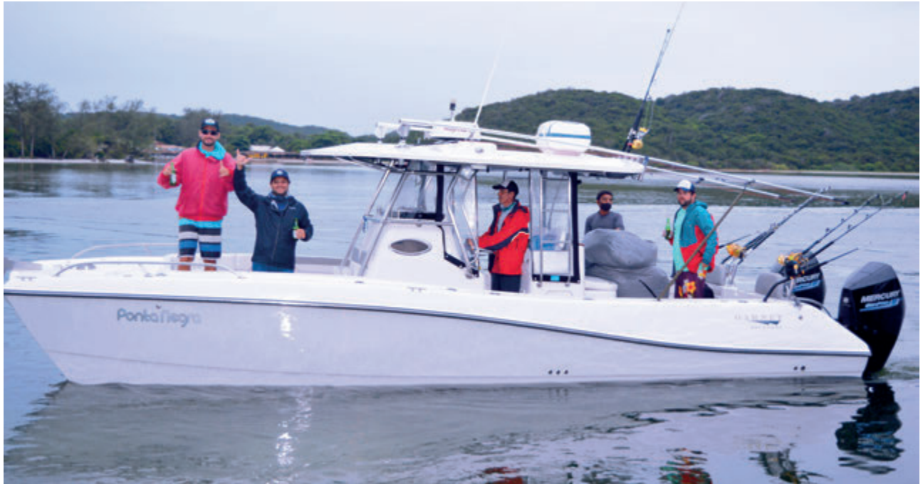
1º lugar - Equipe Ponta Negra

A 29ª edição do Cabo Frio Marlin Invitational, torneio destinado exclusivamente à pesca de Marlin Azuis, aconteceu nos dias 9, 10 e 12 de fevereiro na subsede do ICRJ em Cabo Frio. Neste ano, o lugar conhecido pelo mar agitado e número elevado de strikes teve mar calmo e poucos peixes, totalmente atípico, porém as condições não foram motivos para tirarem o brilho do evento e a garra das 8 equipes participantes.