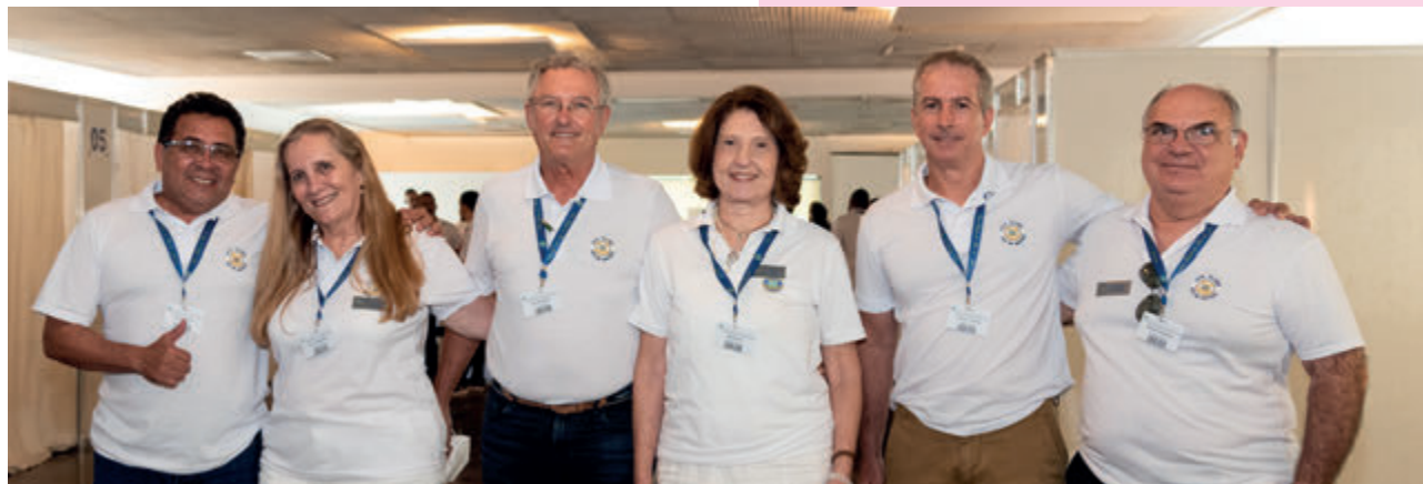
Comissão Eleitoral e Mesa Diretora da Assembleia Geral