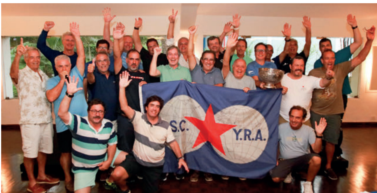
Staristas em confraternização após Regata Darke de Mattos