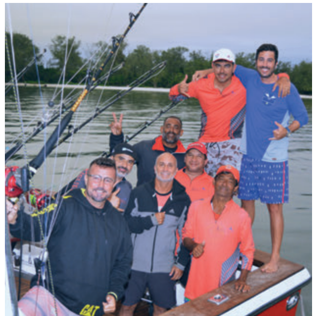
2º lugar - Equipe Kisu