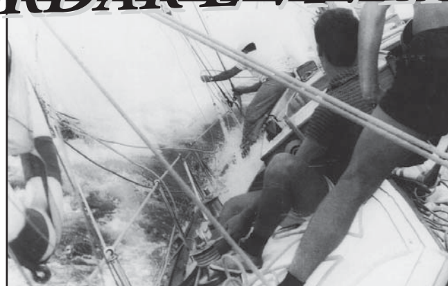
Regata Santos Rio 1962 Barco Pluft