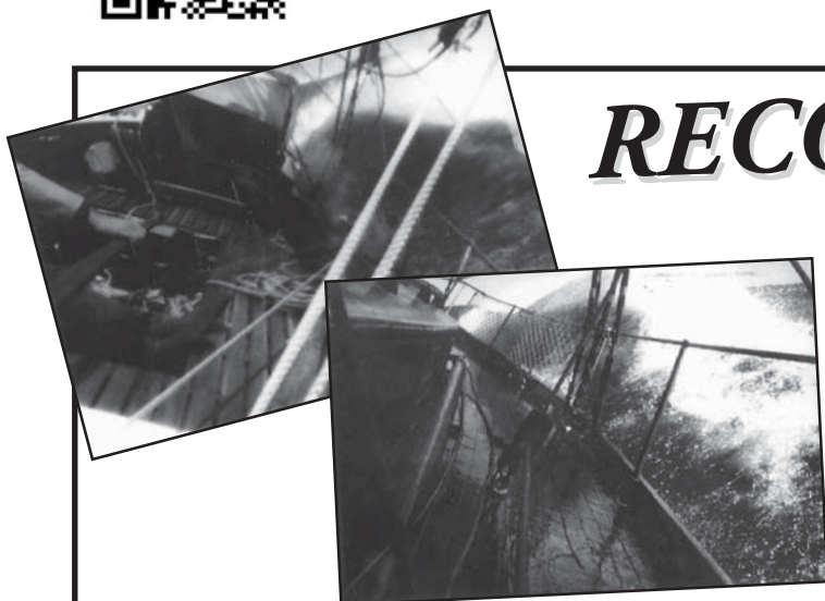
Regata Buenos Aires Rio 1965 Barco Kincaid