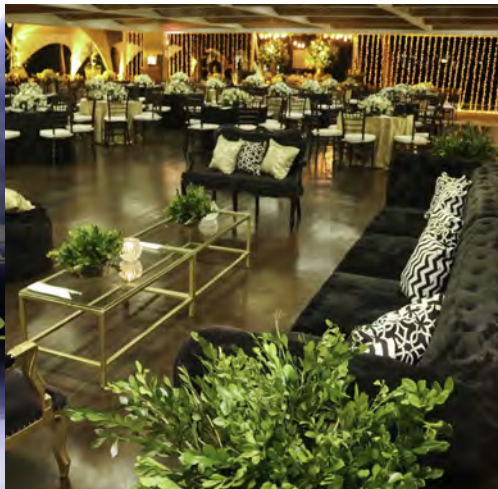
Bolo e decoração na festa de 98 anos do Iate Clube do Rio de Janeiro