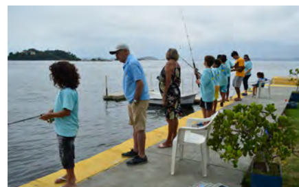
Pescadores em ação