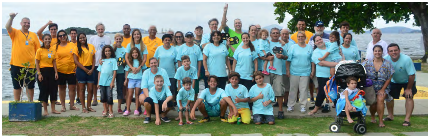
Pescadores e equipe no Torneio de Aniversário do ICRJ de Pesca de Cais