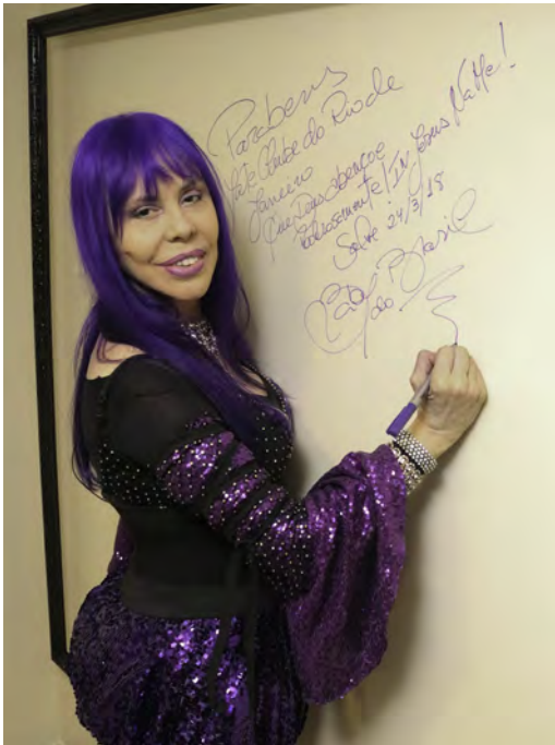
Baby do Brasil inaugura painel de autógrafos no camarim