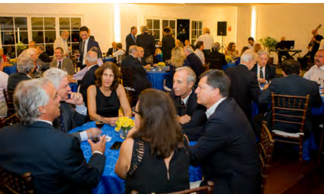
Coquetel no Salão Nobre