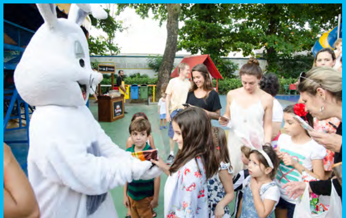
Coelhinho da Páscoa entregando chocolates para a criançada