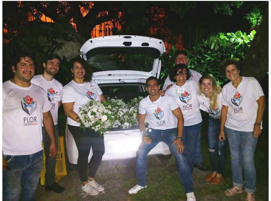
Equipe da ONG Flor Generosa