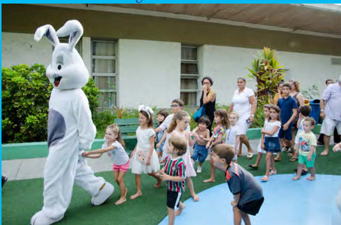
Coelhinho agitando a galerinha