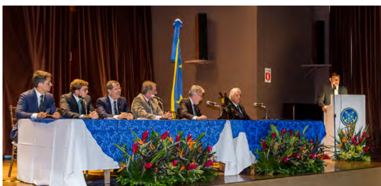
Cerimônia de posse da nova Comodoria presidida pela nova Mesa Diretora do Conselho Deliberativo no Centro Cultural Gabriel Villela