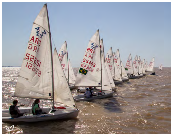
Largada da classe 420 no Sul-Americano, em San Isidro, na Argentina.