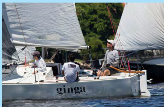
Barco Ginga - 1º Lugar da Classe J24