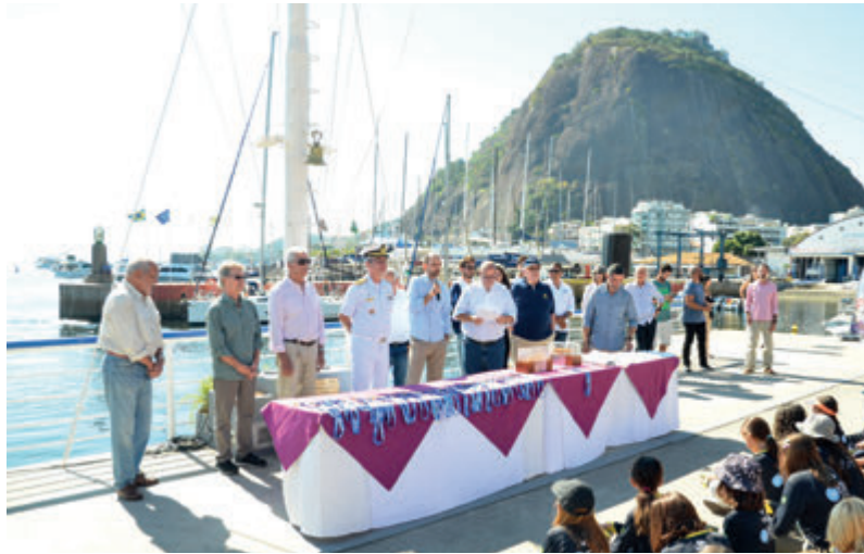
Formatura das turmas de Vela Infantil

“A cada aula evoluímos mais e mais e esse processo foi muito legal. A aula de vela nos ensina muito mais do que velejar. É sobre como encarar os desafios de forma a superá-los, e assim aprendermos com eles. Por fim, agradeço imensamente aos professores da CL Vela e a todos os funcionários da EDN pela paciência e por toda a