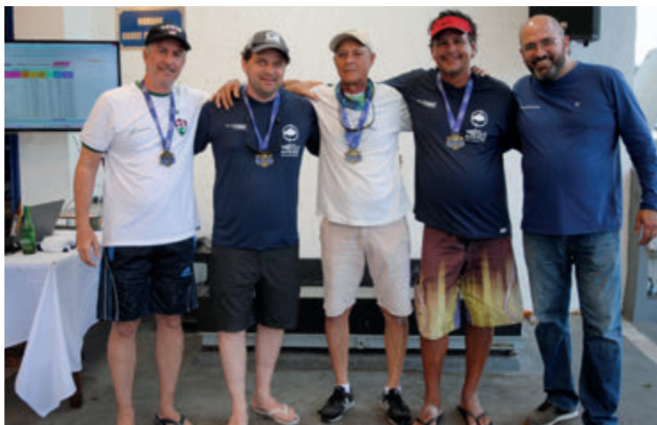
Equipe Colt - 1º lugar

O 30º Torneio Open 25 é realizado pela Pesca do ICRJ com patrocínio da OCM Vertical Jigging e Estaleiro Garnet com a parceria do Posto late. Estão previstas mais duas etapas ainda neste ano para definir o resultado final da competição. Mais informações no site pesca.icrj.com e instagram @pesca.icrj .