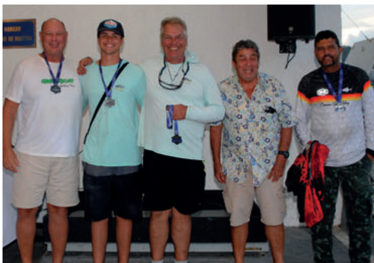
Equipe Pesca Vertical - 2º lugar