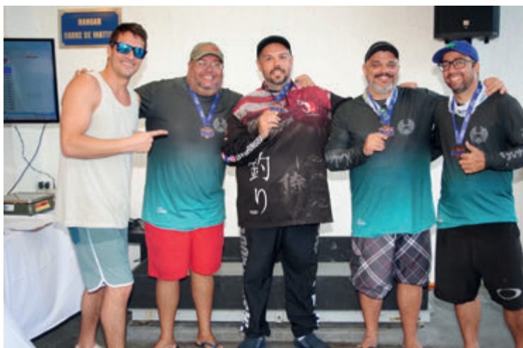
Equipe Kalamares - 3º lugar