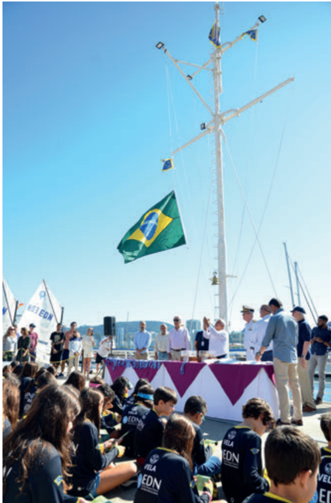
Solenidade realizada no Cais da Bandeira