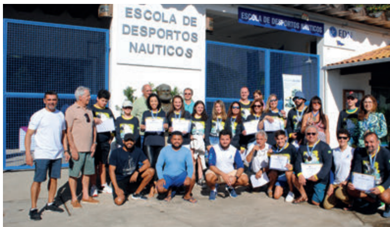
Classe Dingue no hangar da EDN