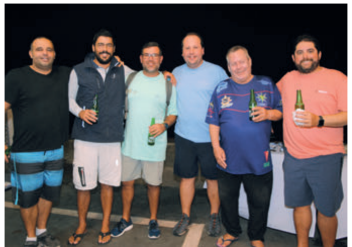
Equipes Galática e Tomahawk