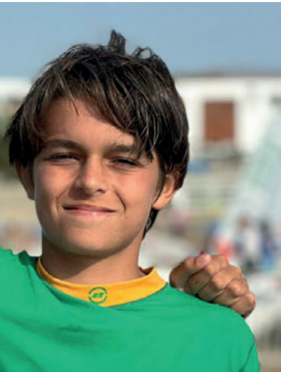
o Sul-Americano da Classe Optimist