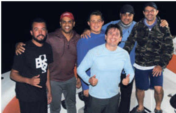
Equipes Luna Blu e Malta