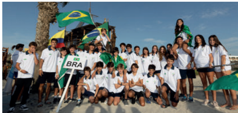
Time Brasil formado por 26 velejadores – 13 da Flotilha Zé Carioca do ICRJ