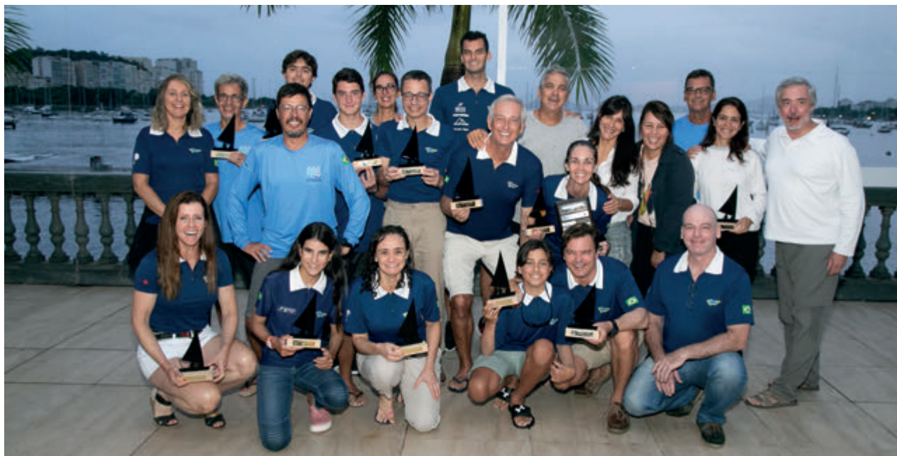
Flotilha da Classe Dingue do ICRJ

O ICRJ sediou, entre os dias 6 e 9 de abril, o Campeonato Estadual de 2023 da Classe Dingue. Participaram, 84 velejadores do Rio de Janeiro, São Paulo e Santa Catarina em 4 regatas realizadas na tradicional raia da Escola Naval, uma das mais técnicas e difíceis do país.