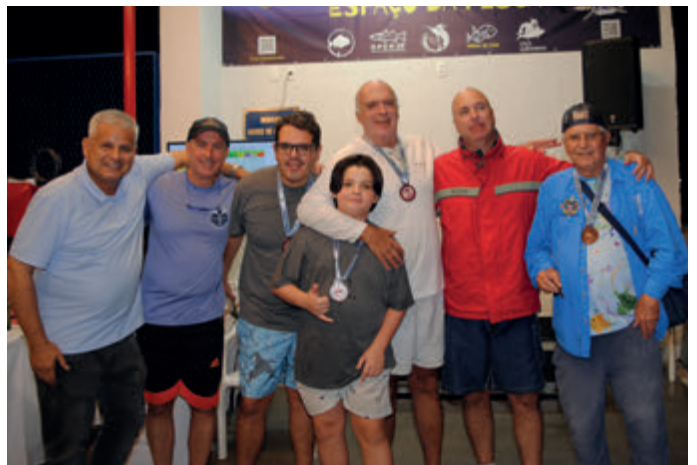
Equipes Barca Velha e Vida Mansa