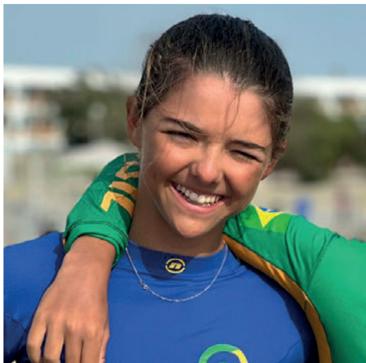
Campeão e vice-campeã (campeã fem.) 2022 e 2023 do Campeonato