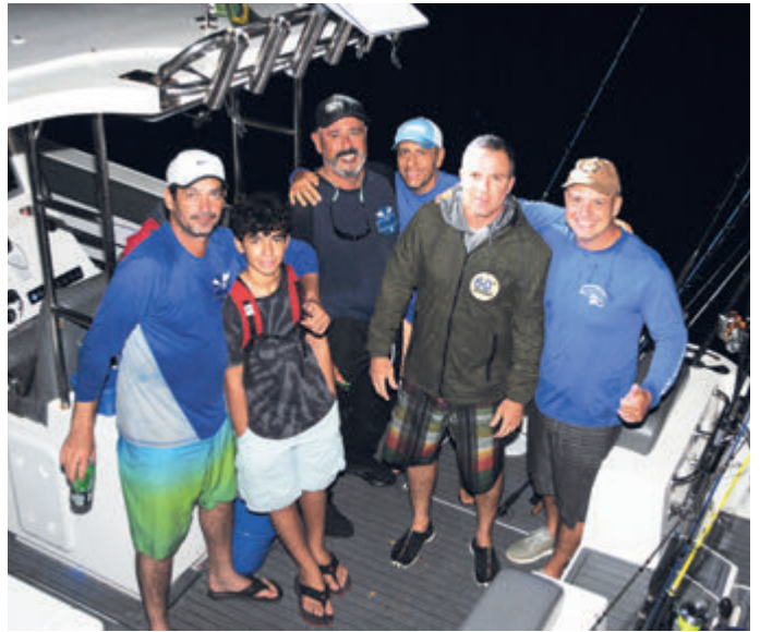
Equipe Fish Finder

O evento teve início com um café da manhã e ao retornar dos barcos, após cerca de 12 horas de pescaria, houve a tradicional pesagem no Espaço da Pesca, no hangar 3, acompanhada de comes, bebes e entrega de prêmios aos vencedores da 2ª etapa do 55º Torneio Anual de Pesca Costeira. A seguir, a relação dos vencedores do dia. Para resultados completos e próximos torneios, acesse pescaicrj.com .