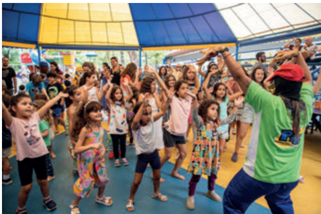
Recreação no Cirquinho Popeye