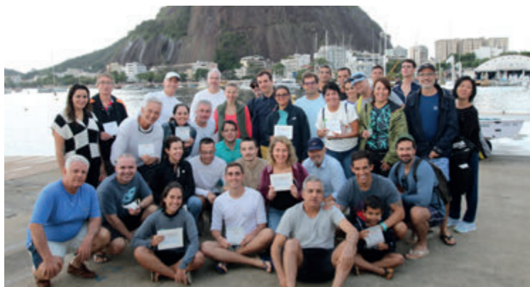
Classe Dingue em confraternização após a regata