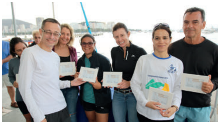
Vencedores da Regata Flotilha 35