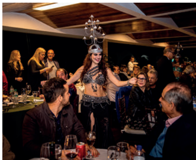
Show de danças folclóricas