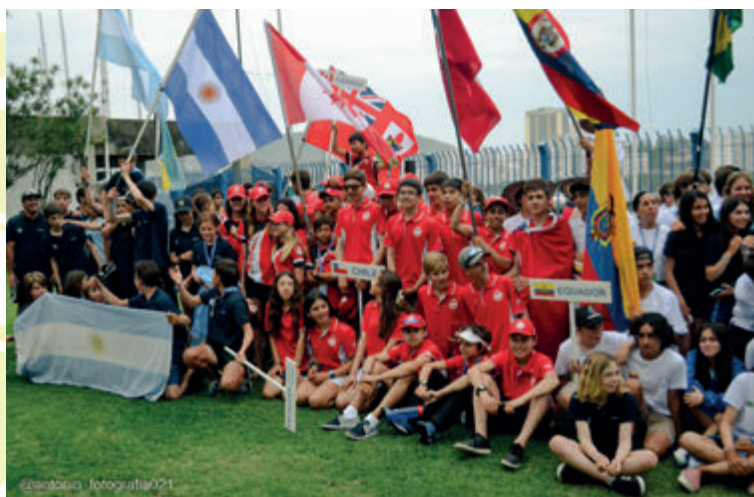
Delegações da Argentina, Bahamas, Bermudas, Canadá, Chile, Colômbia, Equador, Guatemala, Peru, Porto Rico, Estados Unidos, Uruguai, Venezuela e Brasil participaram do evento