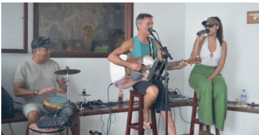
Música ao vivo animou a festa