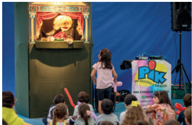
Teatro de fantoches

O evento foi gratuito e exclusivo aos sócios e seus convidados. A produção ficou por conta do setor Social em parceria com a Pik Eventos. Para mais fotos, acesse icrj.com.br .