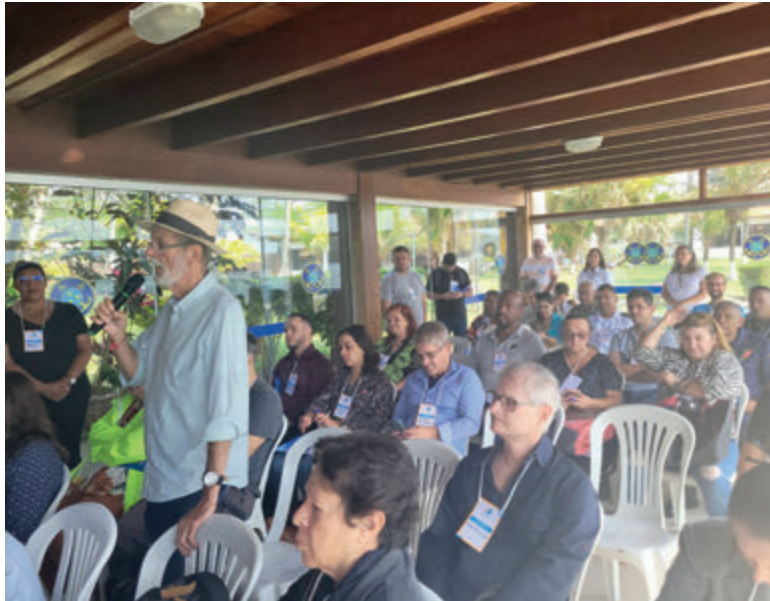
Prefeito José Bonifácio Ferreira na subsede Cabo Frio

O Projeto Orla tem como premissa a compatibilização das políticas ambiental, urbana e patrimonial por meio da gestão costeira integrada no âmbito municipal, o que abrange o fortalecimento da capacidade de atuação da sociedade através de uma gestão participativa.