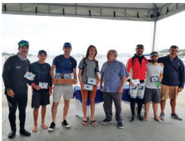
Premiados da Taça Ivan Pimentel