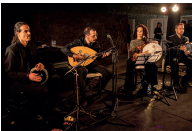
Música ao vivo