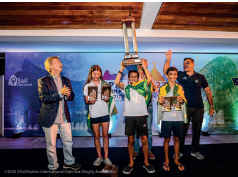
Cerimônia de premiação na pérgula da piscina