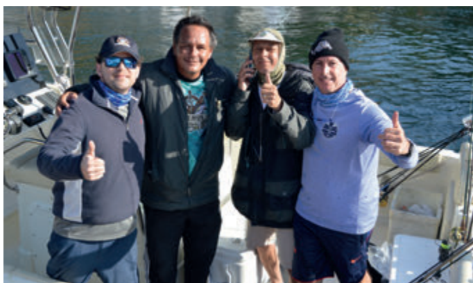
Equipe Colt - campeã

Os agradecimentos especiais por mais um torneio de sucesso vão aos parceiros Estaleiro Garnet e OCM Vertical Jigging, além de todos os pescadores participantes que contribuíram com a campanha de arrecadação de alimentos para doação às instituições de caridade.