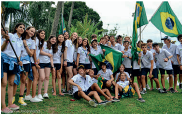
O Brasil teve a maior delegação com 40 velejadores com idades entre 12 e 15 anos.