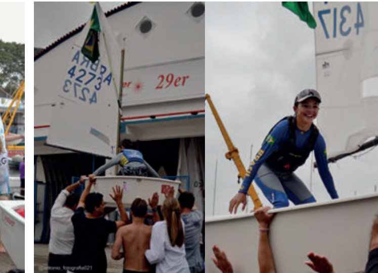
Os campeões na chegada ao hangar carregados pela torcida