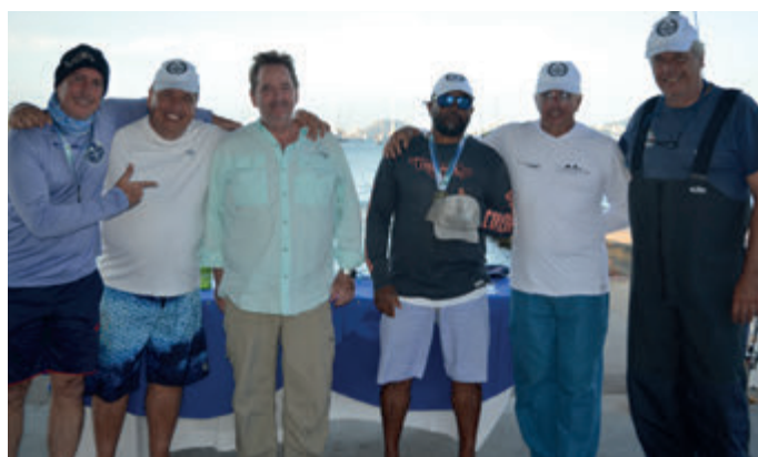
Equipe Release- vice-campeã