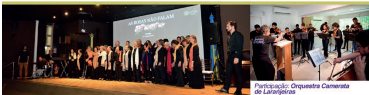
Participação: Orquestra Camerata de Laranjeiras

18 de novembro, sexta-feira, às 19h, no Centro Cultural