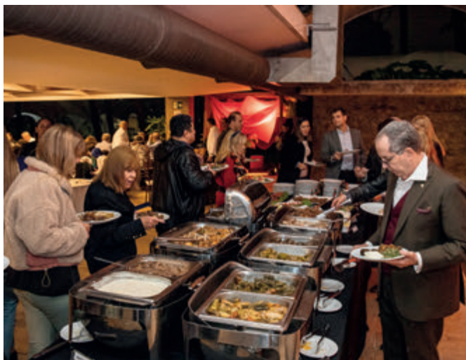
Buffet de comidas típicas na pérgula da piscina

Na decoração, tendas de cores fortes, detalhes dourados e uma iluminação aconchegante fizeram sucesso com o público, que aproveitou para tirar muitas fotos. As apresentações artísticas abrangeram música ao vivo e danças folclóricas com bastão, espada, candelabro e véus.