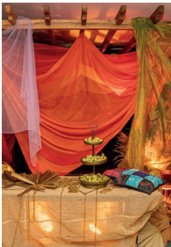
Decoração temática com espaço para fotos