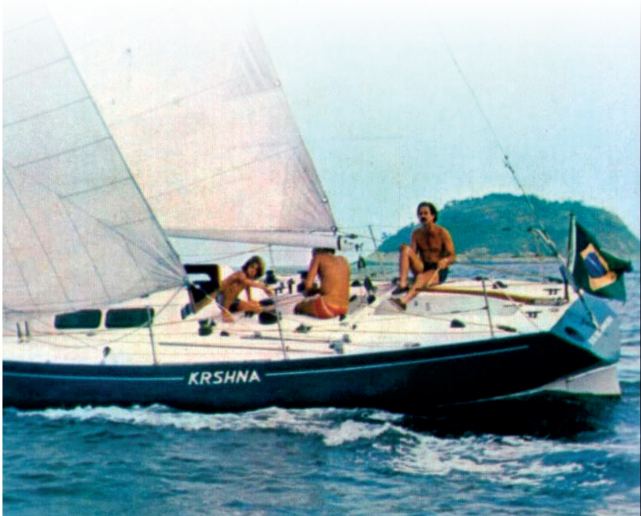
Krishna, de Roberto Pellicano, em 1978

Roberto Pellicano é um exemplo de paixão pelo mar, de cumplicidade com o vento, dedicação à família, ao esporte da vela e ao late Clube do Rio de Janeiro, onde é conselheiro até hoje.