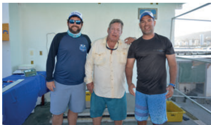
Equipe Galática - 3ª colocada